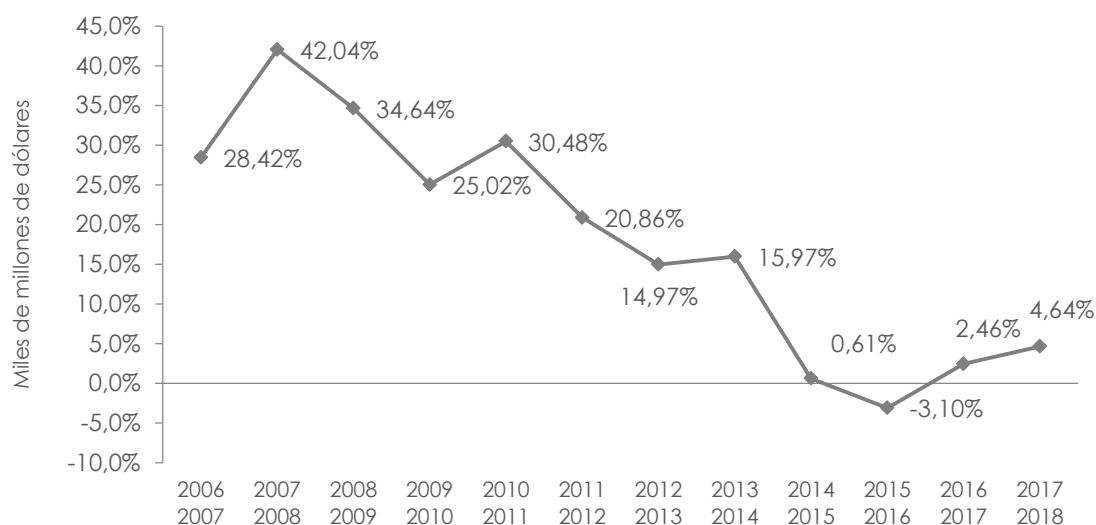
Figura 2: Tasa de variación remuneraciones, periodo 2006 – 2018

variación, tal como se muestra en la siguiente gráfica: